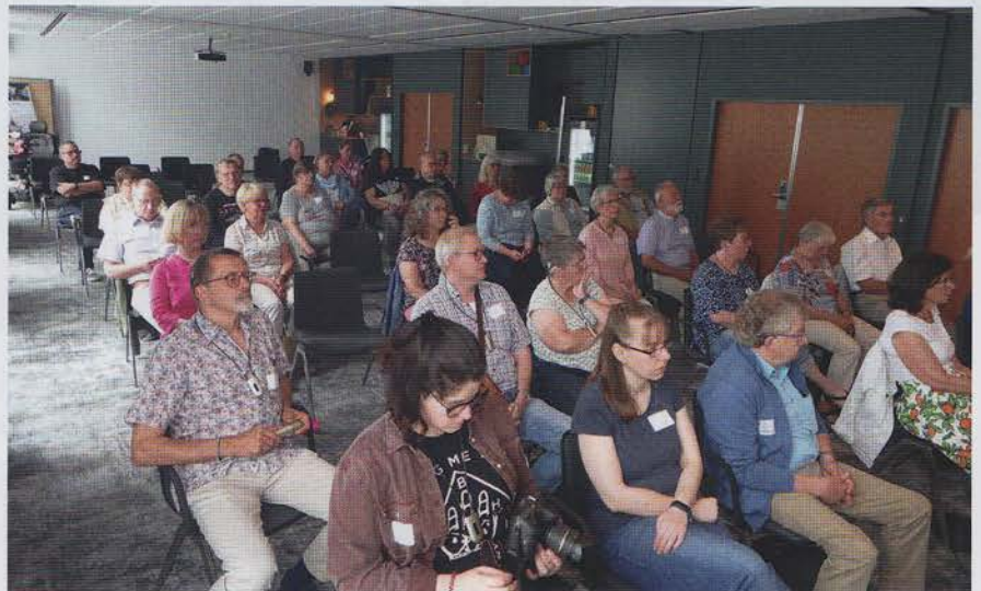
Zuhörer bei der diesjährigen Generalversammlung.

Sommerzeit ist Festivalzeit. Und so ziehen die großen Veranstaltungen, nach langer, zwangsläufiger Coronapause, wieder die Massen an. Aber es geht auch kleiner, gemütlicher und mindestens genauso schön. Dafür nehme man, je nach Anfahrtsweg, entweder ein Fahrrad, die U-Bahn, das Auto, des Schusters Rappen oder eben den Zug. Das Ziel: das Hotel Mercure in Hannover und das alljährliche Sommerfest der HCIG. Letzteres war es auch, was mich nach langer Zeit wieder einmal dorthin brachte.