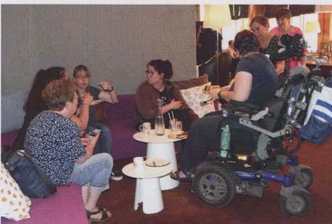
Gespräche im Foyer

Nancy Unmack (Text)